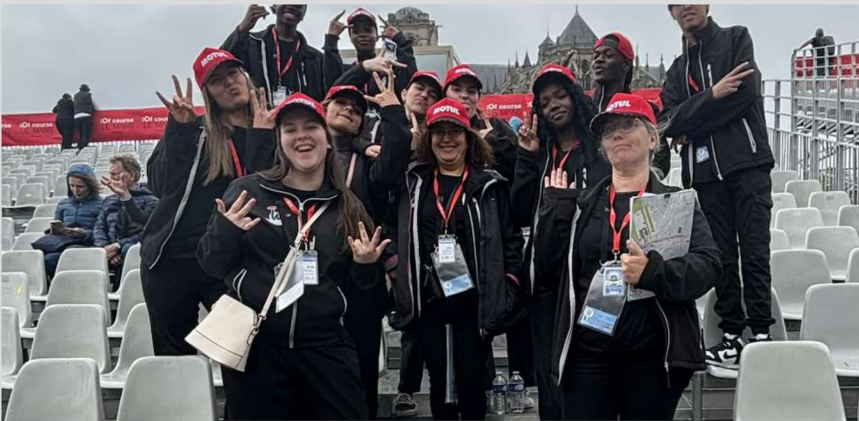
Les élèves de première MA et leur professeurs, à la parade 2024