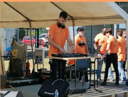
Photos de la Journée de l'Engagement septembre 2023