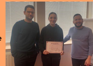
Prix de l'Excellence économique